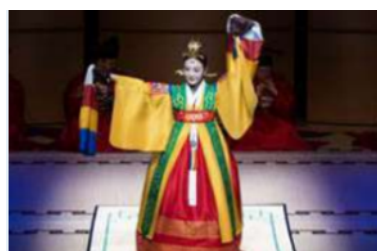
( 평조회상 )