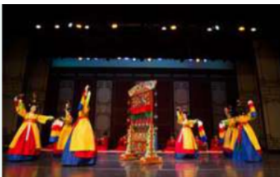
( 관악영산회상 중 삼현도드리, 타령, 자진타령 )